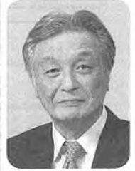
東京タクシー防犯協力会副会長